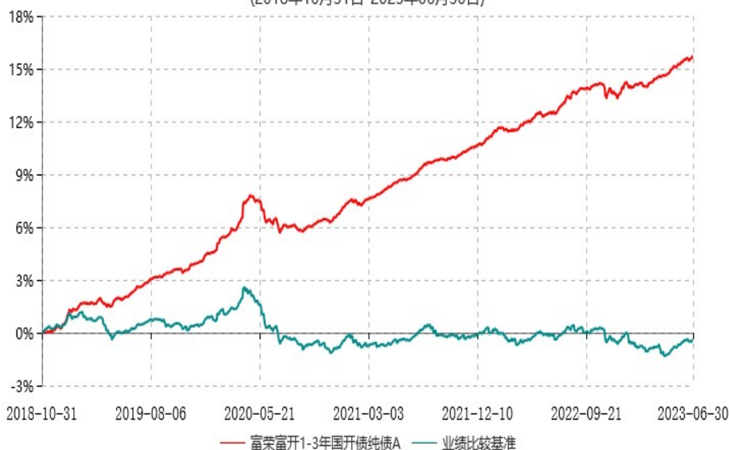
富荣富开1-3年国开债纯债A累计净值增长率与业绩比较基准收益率历史走势对比图 (2018年10月31日-2023年06月30日)