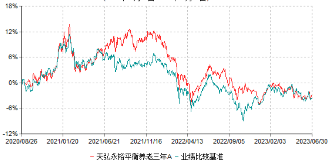
天弘永裕平衡养老三年A累计净值增长率与业绩比较基准收益率历史走势对比图 (2020年08月26日-2023年06月30日)