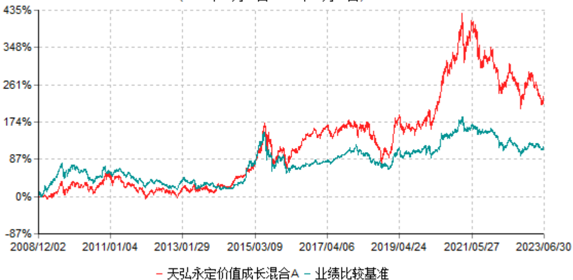
天弘永定价值成长混合A累计净值增长率与业绩比较基准收益率历史走势对比图 (2008年12月02日-2023年06月30日)