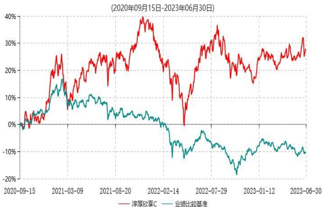
淳厚欣享C累计净值增长率与业绩比较基准收益率历史走势对比图

注：本基金基金合同生效日为 2020 年 9 月 15 日。按基金合同规定，本基金自基金合同生效起 6 个月内为建仓期。建仓期结束时本基金的各项投资比例均符合基金合同约定。