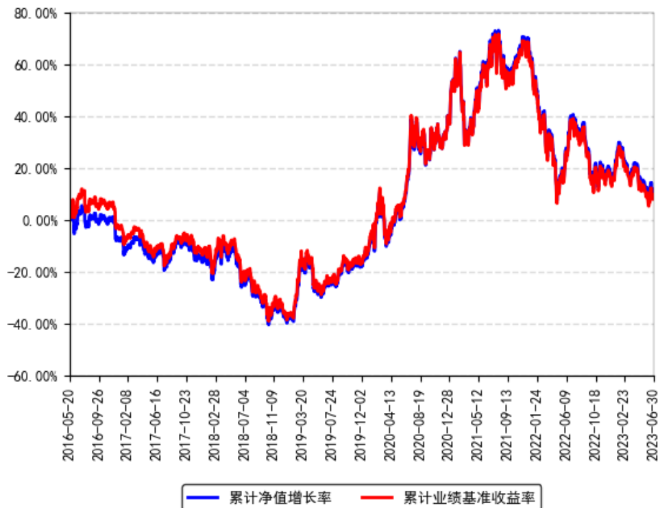
南方创业板ETF联接A累计净值增长率与同期业绩比较基准收益率的历史走势对比图