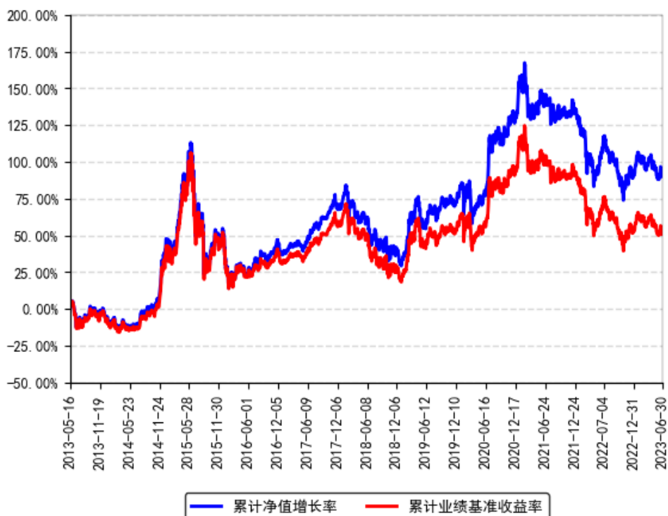
南方沪深300ETF联接A累计净值增长率与同期业绩比较基准收益率的历史走势对比图