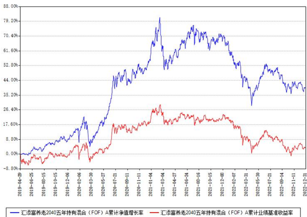
汇添富养老2040五年持有混合 (FOF) Y累计净值增长率与同期业绩基准收益率对比图