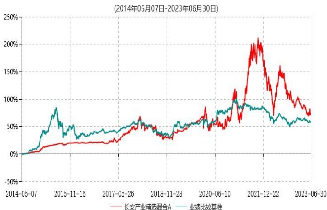
长安产业精选混合A累计净值增长率与业绩比较基准收益率历史走势对比图