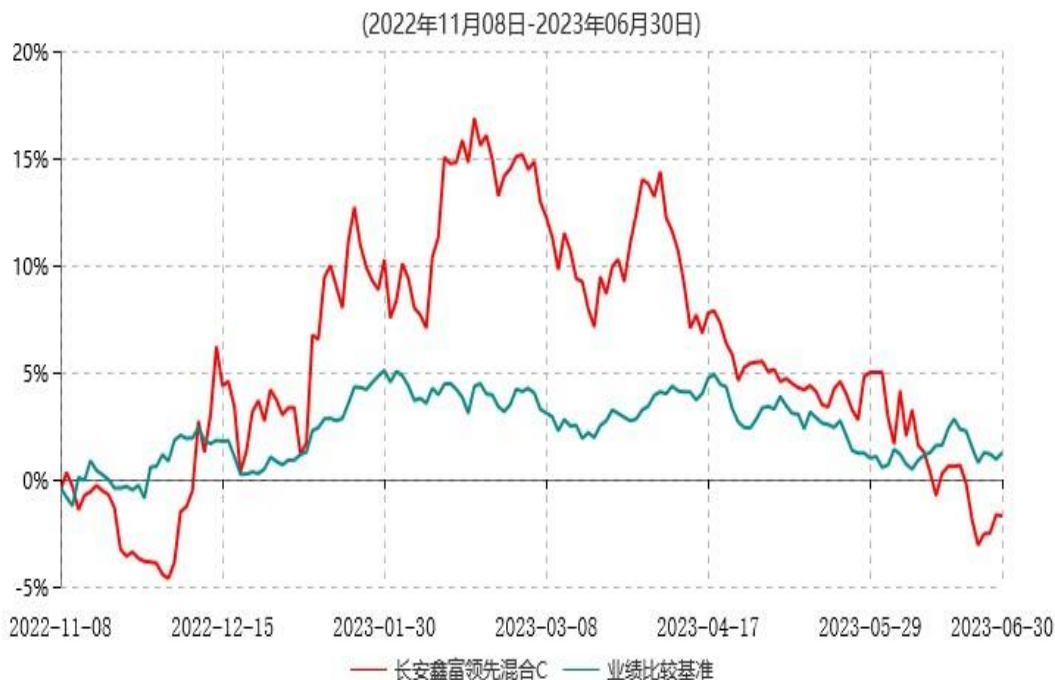
长安鑫富领先混合C累计净值增长率与业绩比较基准收益率历史走势对比图

长安鑫富领先混合于 2022 年 11 月 7 日公告新增 C 类份额，实际首笔 C 类份额申购申请于 2022 年 11 月 8 日确认，图示日期为 2022 年 11 月 8 日至 2023 年 6 月 30 日。