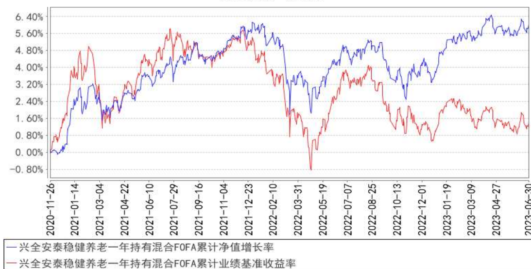
兴全安泰稳健养老一年持有混合FOFA累计净值增长率与同期业绩比较基准收益率的历史走势对比图