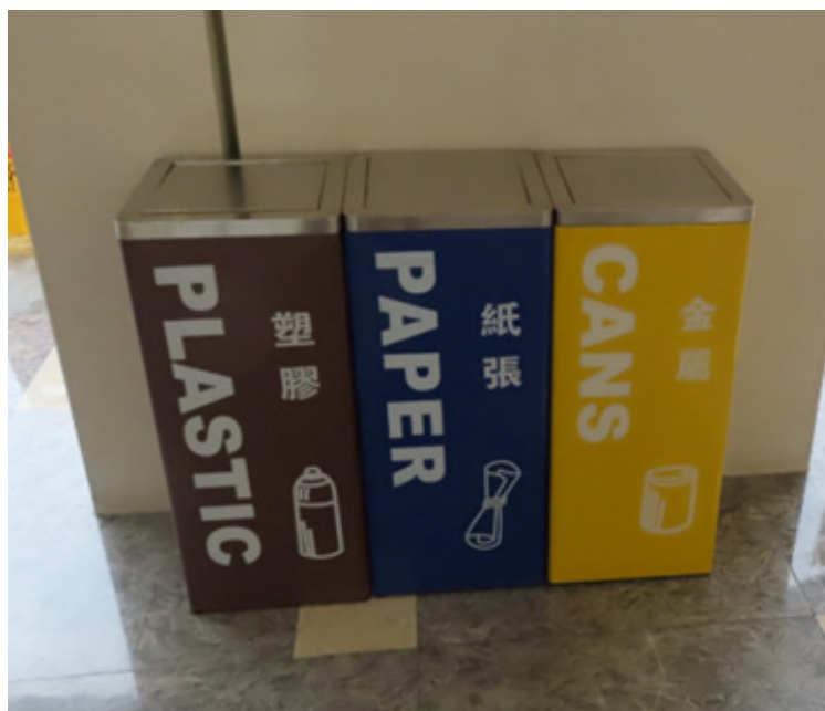
本酒店大堂的廢物分類箱

為盡量減少業務營運中產生的無害廢物對環境的影響，本集團參考既定的環境政策於日常營運及後勤辦公室採取相關措施，藉此處理有關廢物及推行不同的節約倡議，相關措施及倡議包括但不限於以下各項：