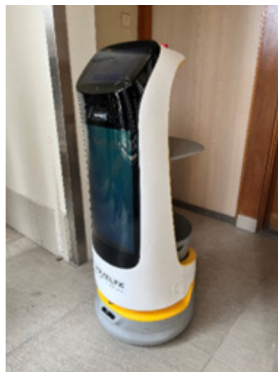
酒店區域已使用空氣淨化機和送餐機器人