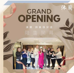
沐蘭調景嶺店新開幕