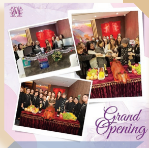
現代美容中心葵芳新店開幕