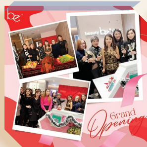
Be Beauty Shop葵芳新店開幕