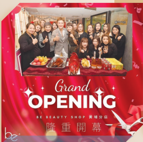
Be Beauty Shop黃埔新店開幕