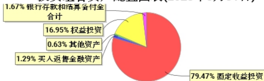
投资组合资产配置图表(2023年3月31日)

● 固定收益投资 ● 买入返售金融资产 ● 其他资产 ● 权益投资 ● 银行存款和结算备付金合计