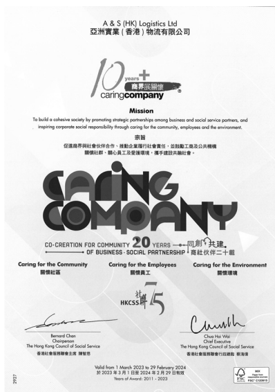
圖 1：來自商界展關懷的證明書

本集團將繼續探尋其他方式向環境作出更多貢獻，並促進構建未來的健康可持續發展社會。