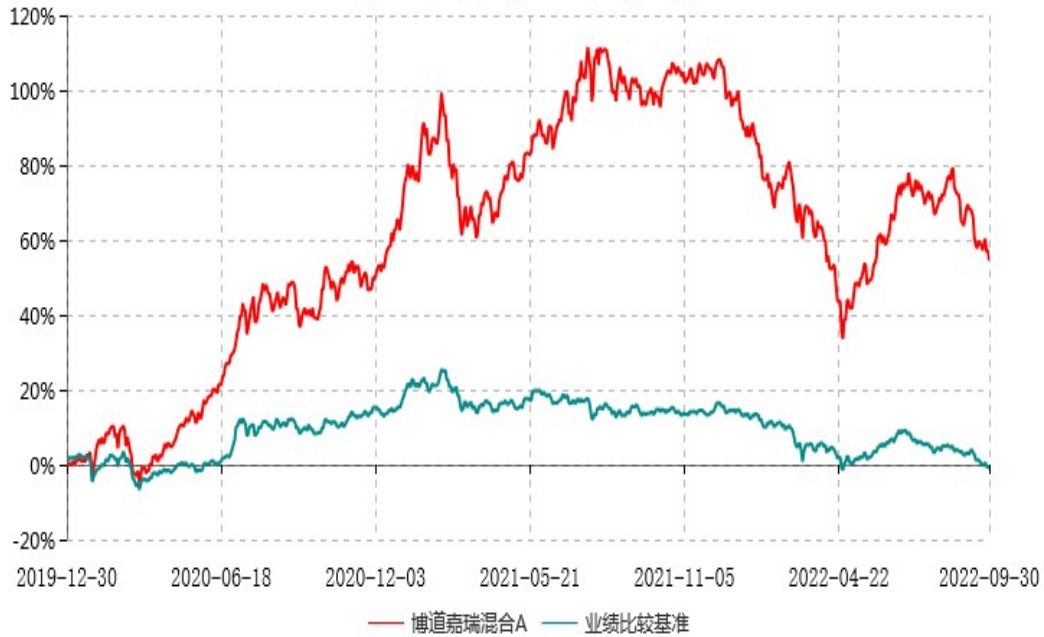
博道嘉瑞混合A累计净值增长率与业绩比较基准收益率历史走势对比图 (2019年12月30日-2022年09月30日)

注：本基金建仓期为自基金合同生效日起的6个月。截至建仓期结束，本基金各项资产配置比例符合基金合同及招募说明书有关投资比例的约定。