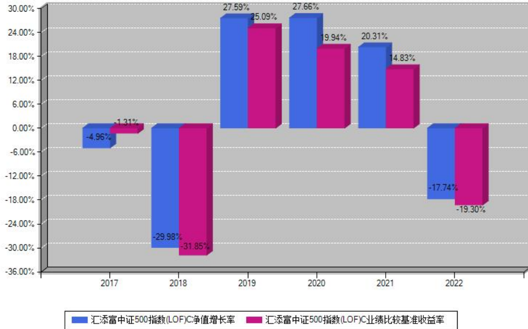
汇添富中证500指数(LOF)C每年净值增长率与同期业绩基准收益率对比图

注：基金的过往业绩不代表未来表现。本《基金合同》生效之日为2017年08月10日，合同生效当年按实际存续期计算，不按整个自然年度进行折算。