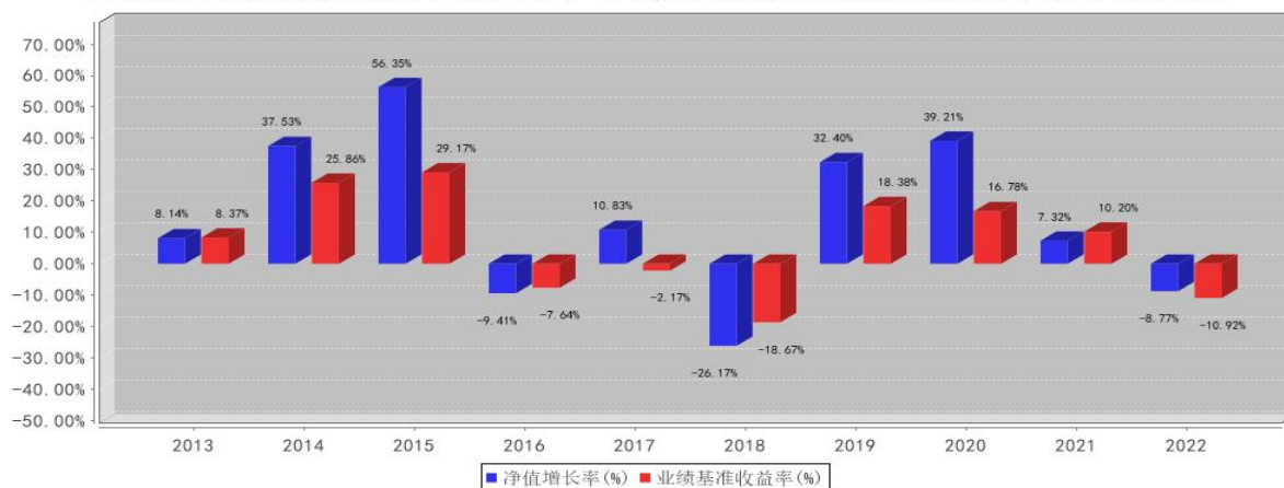
国联安小盘精选混合基金每年净值增长率与同期业绩比较基准收益率的对比图2022年12月31日