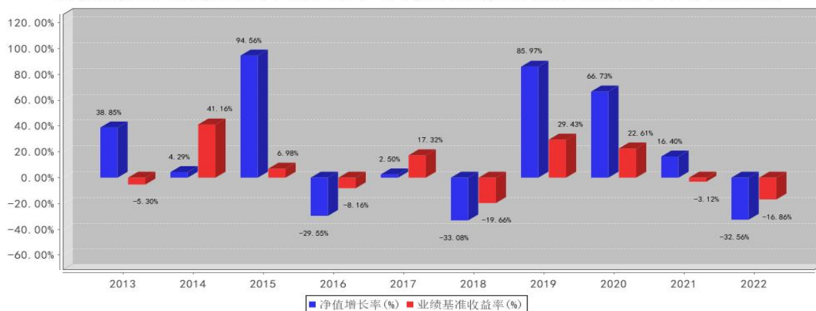
国联安优选行业混合基金每年净值增长率与同期业绩比较基准收益率的对比图2022年12月31日