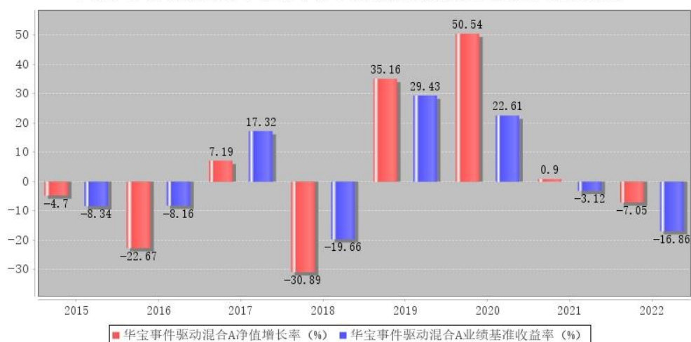
华宝事件驱动混合A每年净值增长率与同期业绩比较基准收益率的对比图