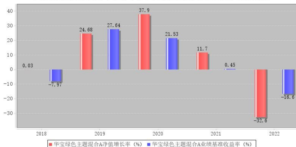
华宝绿色主题混合A每年净值增长率与同期业绩比较基准收益率的对比图