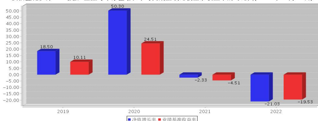
安信量化沪深300增强A基金每年净值增长率与同期业绩比较基准收益率的对比图(2022年12月31日)

注:基金合同生效当年期间的相关数据按实际存续期计算。基金的过往业绩并不代表其未来表现。