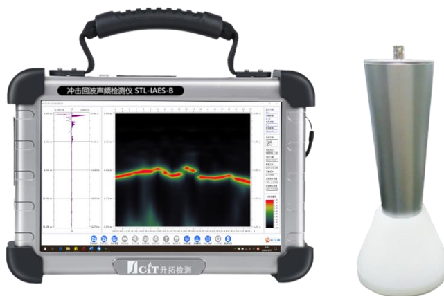
冲击回波声频检测仪

我司深耕工程无损检测行业 19 年，在基于冲击弹性波的检测领域形成了完整的解决方案。在信号激发和拾取方面，开发有接触式、半接触式、非接触式弹性波信号高保真拾取方法，和连续、自动激振技术和设备，解决了弹性波现场测试中的信号质量与作业效率相矛盾的关键性难题；在检测设备搭载方面，研发了轮式和攀爬式搬运机器人（AGV），实现了少人化作业，提高了检测效率；在数据采集平台方面，基于工控机（IPC）和智能手机（SP）开发了详检和巡检两大产品系列；在解析和信号处理方面，针对行业需求研发了一系列算法和相应的 2/3D 数字成像、数字孪生等技术。其中我司自主研发生产的冲击回波声频检测仪入选四川省重大技术装备首台套软件首版次推广应用指导目录。