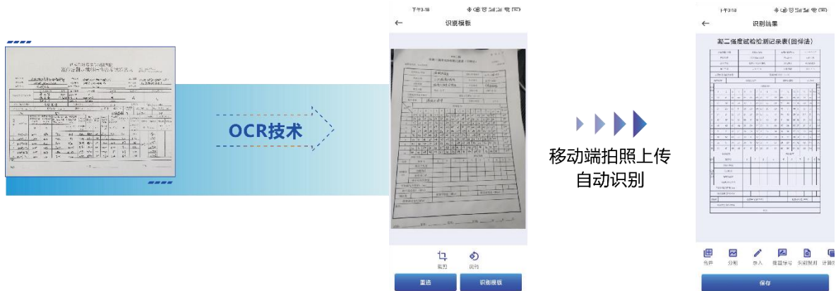
纸质表单识别技术

了广泛的关注。其中，针对试验、检测行业中广泛存在的手填表格型分析项目，发明了基于 OCR 的数字 化处理技术，实现了自定义、同一格式的手填、PC 端和手机端录入的自动识别和解析，可大幅提高作业 效率和精度。此外，搭载的人工智能（AI）工具包在弹性波信号分析、图像识别等方面已经陆续产品化， 以期推动行业的数字化升级。