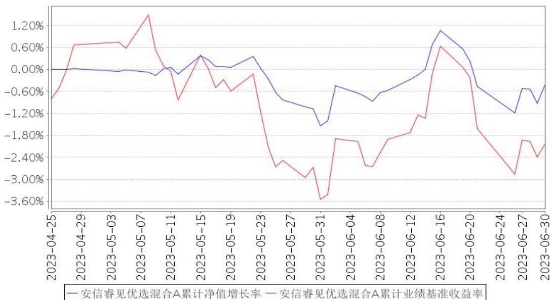
安信睿见优选混合A累计净值增长率与同期业绩比较基准收益率的历史走势对比图