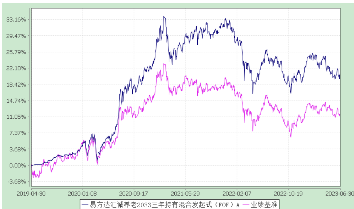
易方达汇诚养老 2033 三年持有混合发起式（FOF）Y