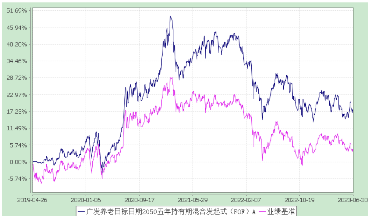
广发养老目标日期 2050 五年持有期混合发起式（FOF）Y