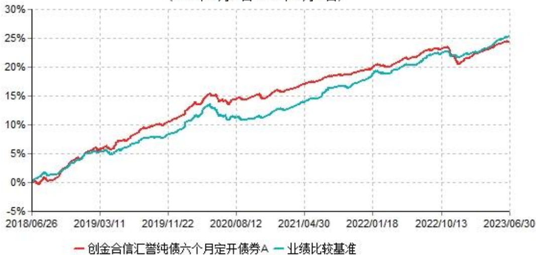
创金合信汇誉纯债六个月定期开放债券A累计净值增长率与业绩比较基准收益率历史走势对比图 (2018年06月26日-2023年06月30日)