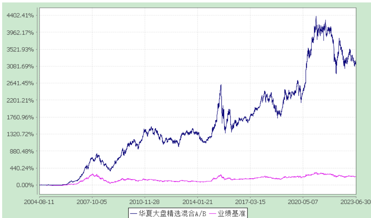
华夏大盘精选混合 C