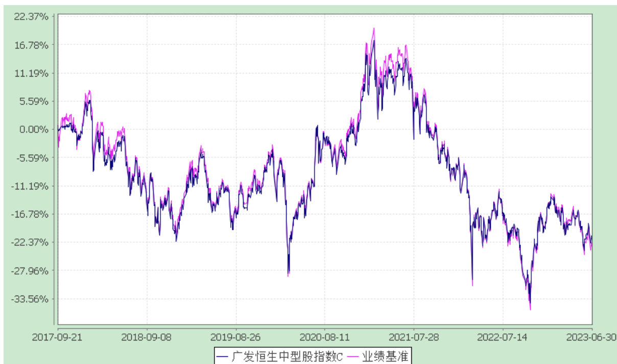
广发恒生中型股指数 (LOF) E