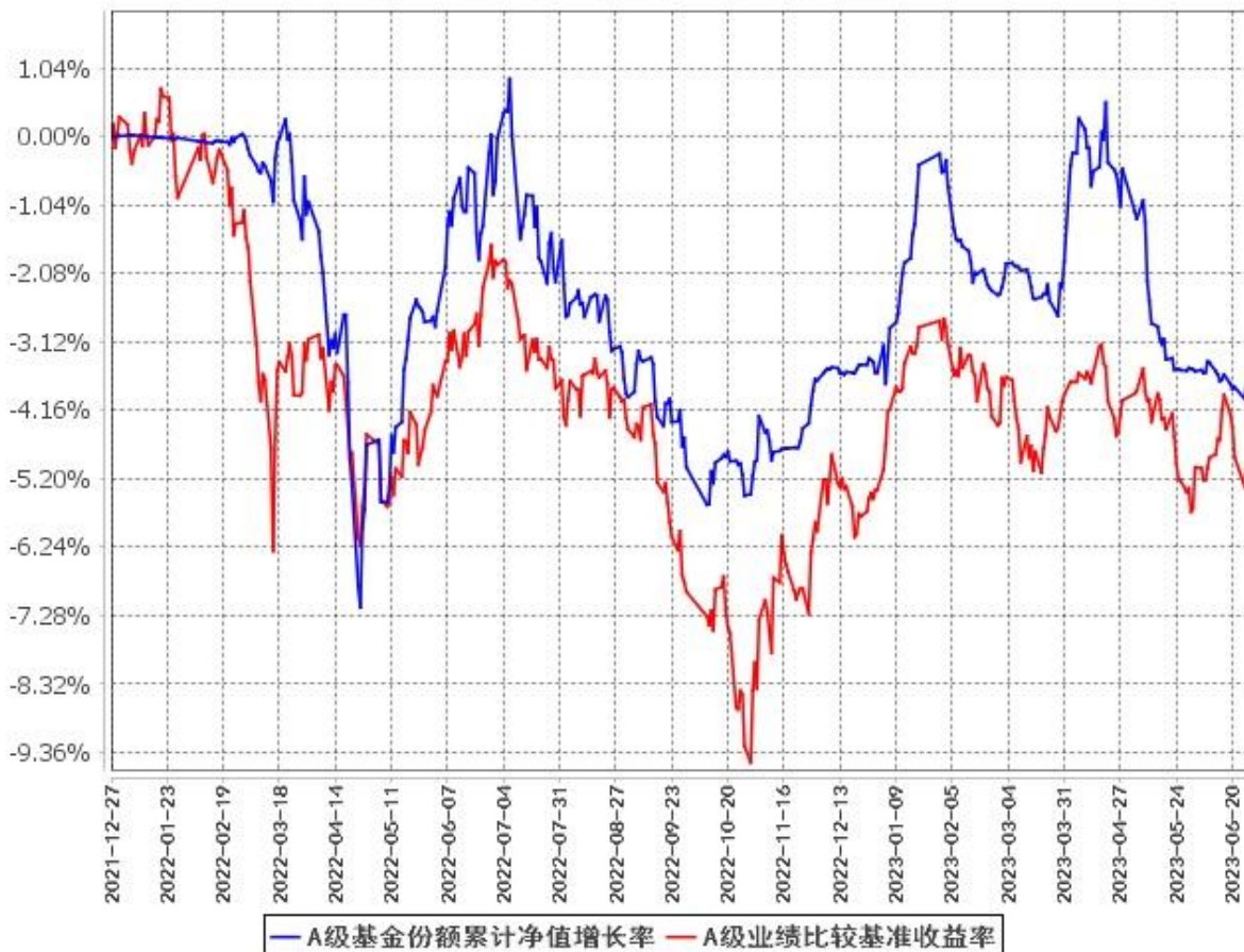
A级基金份额累计净值增长率与同期业绩比较基准收益率的历史走势对比图 (2021年12月27日至2023年6月30日)