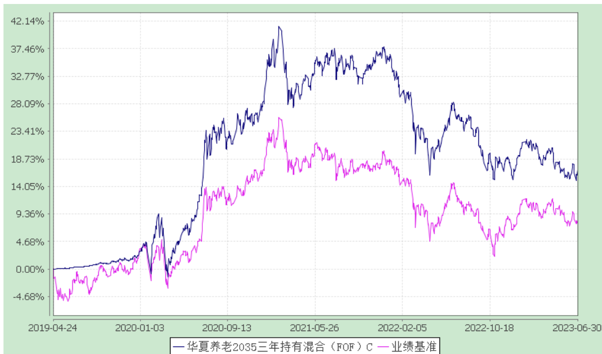
华夏养老 2035 三年持有混合（FOF）Y