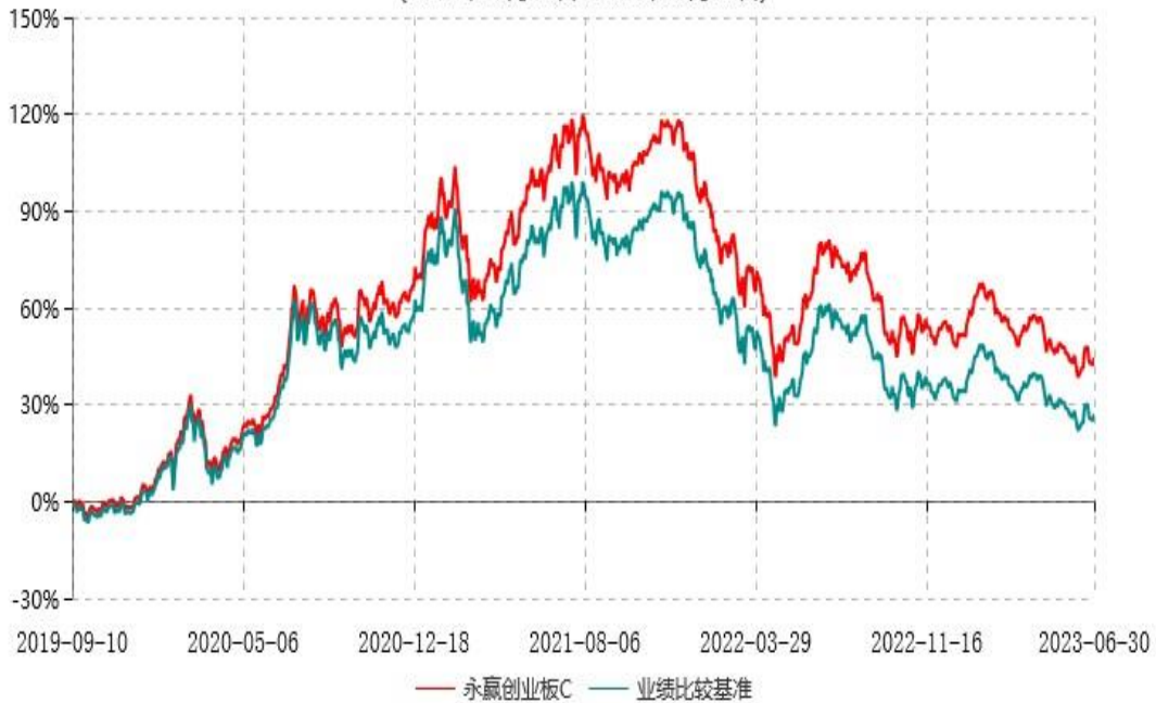
永赢创业板C累计净值增长率与业绩比较基准收益率历史走势对比图 (2019年09月10日-2023年06月30日)