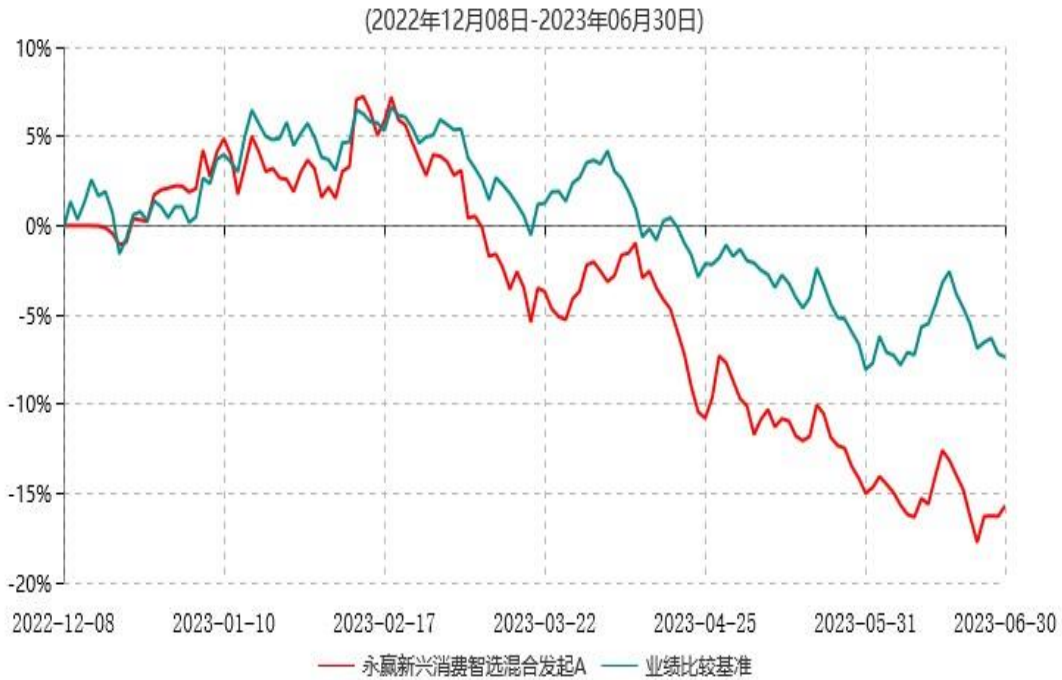
永赢新兴消费智选混合发起A累计净值增长率与业绩比较基准收益率历史走势对比图