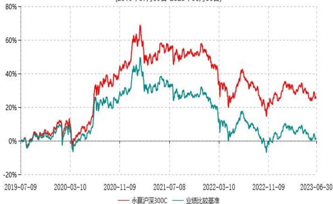
永赢沪深300C累计净值增长率与业绩比较基准收益率历史走势对比图 (2019年07月09日-2023年06月30日)