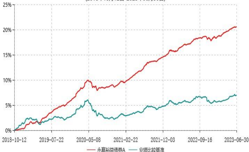
永赢裕益债券A累计净值增长率与业绩比较基准收益率历史走势对比图 (2018年10月12日-2023年06月30日)