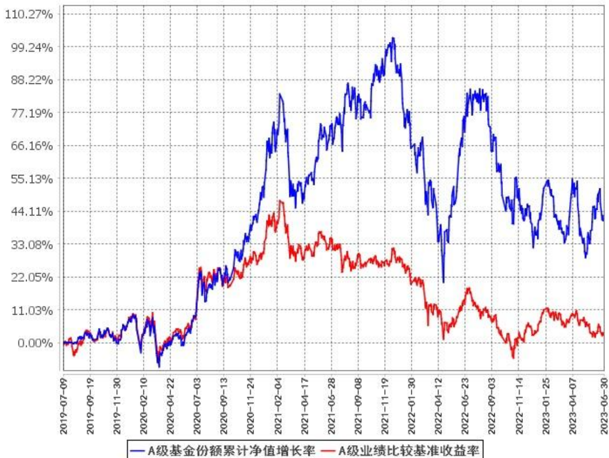
A级基金份额累计净值增长率与同期业绩比较基准收益率的历史走势对比图 (2019年7月9日至2023年6月30日)