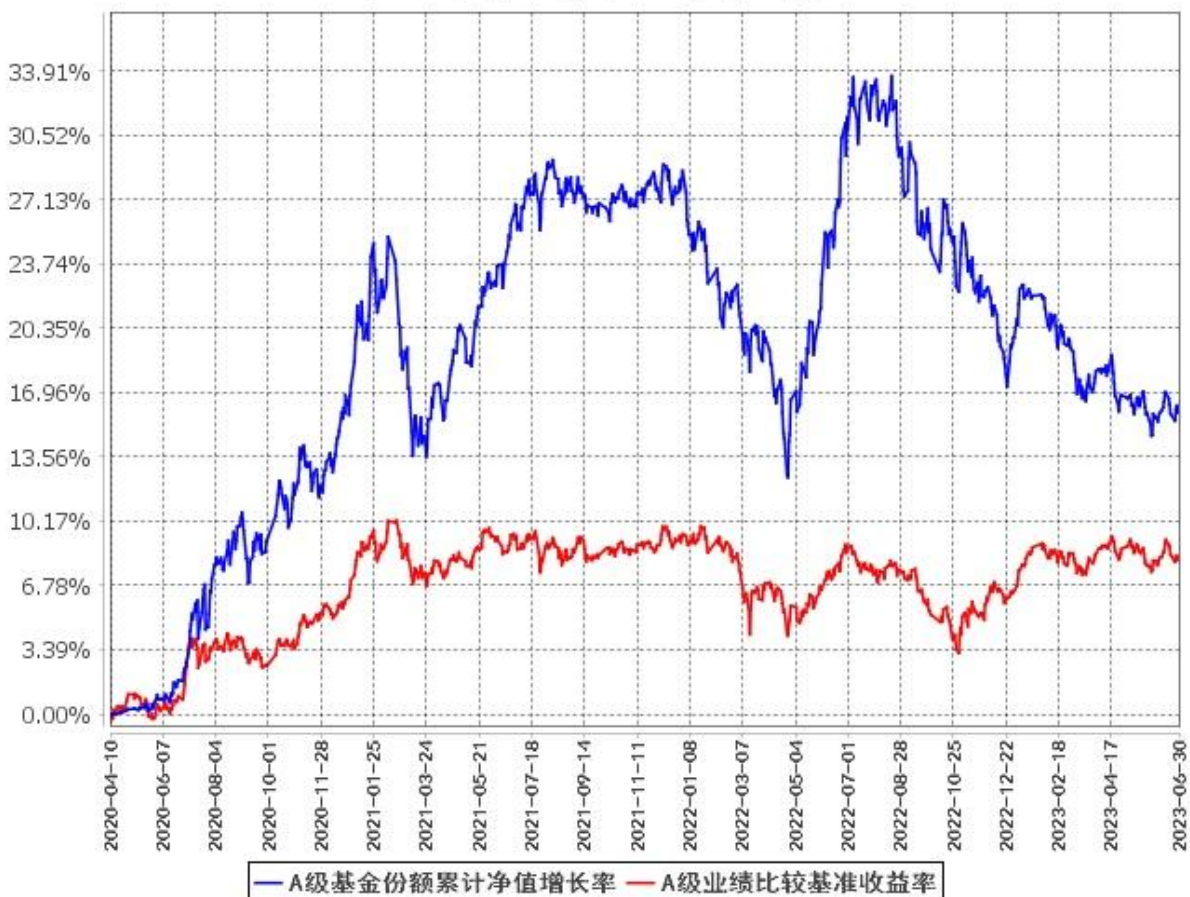
A级基金份额累计净值增长率与同期业绩比较基准收益率的历史走势对比图 (2020年4月10日至2023年6月30日)