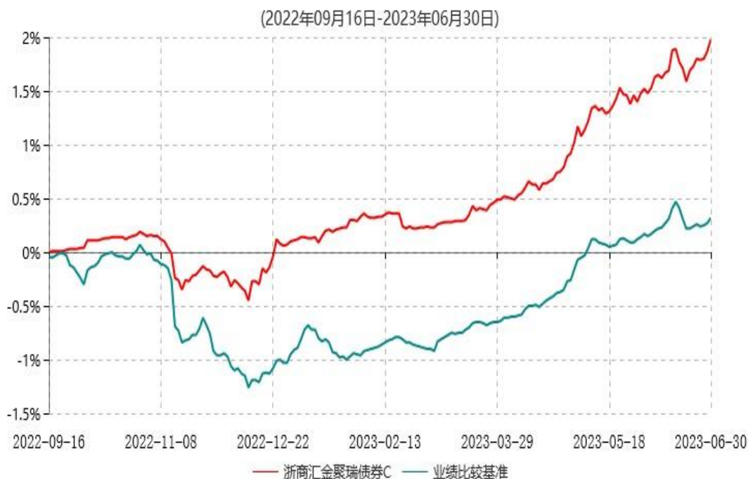
浙商汇金聚瑞债券C累计净值增长率与业绩比较基准收益率历史走势对比图

注：本基金的基金合同生效日为2022年09月16日，自基金合同生效日起至本报告期末不满一年，至本报告期末，本基金已完成建仓。建仓期为2022年9月16日-2023年3月15日，但报告期末距建仓结束不满一年，建仓期结束时各项资产配置比例符合合同约定。