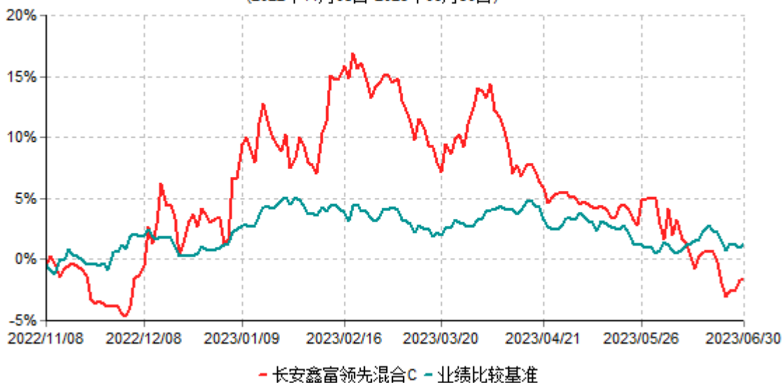
长安鑫富领先混合C累计净值增长率与业绩比较基准收益率历史走势对比图 (2022年11月08日-2023年06月30日)

长安鑫富领先混合于2022年11月7日公告新增C类份额，实际首笔C类份额申购申请于2022年11月8日确认，图示日期为2022年11月8日至2023年6月30日。