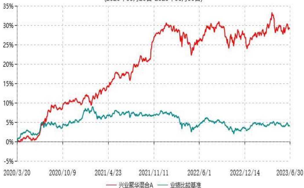
兴业聚华混合C累计净值增长率与业绩比较基准收益率历史走势对比图