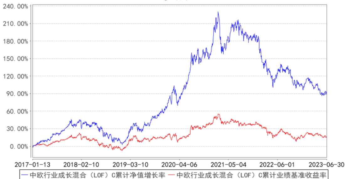
中欧行业成长混合 (LOF) C 累计净值增长率与同期业绩比较基准收益率的历史走势对比图

注：本基金自 2017 年 1 月 12 日起新增 C 类份额，图示日期为 2017 年 1 月 13 日至 2023 年 06 月 30 日。