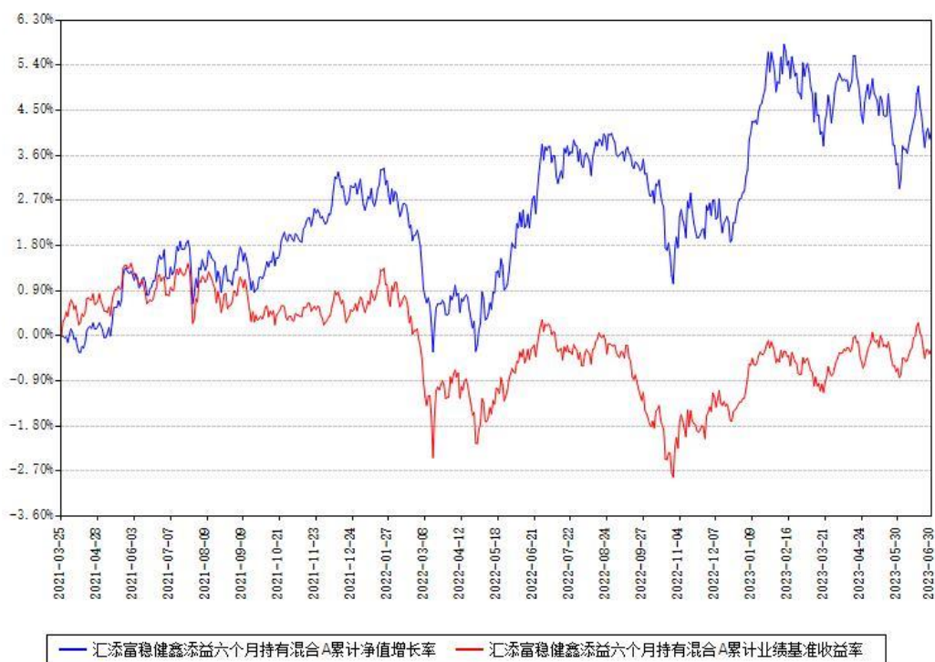
汇添富稳健鑫添益六个月持有混合A累计净值增长率与同期业绩基准收益率对比图