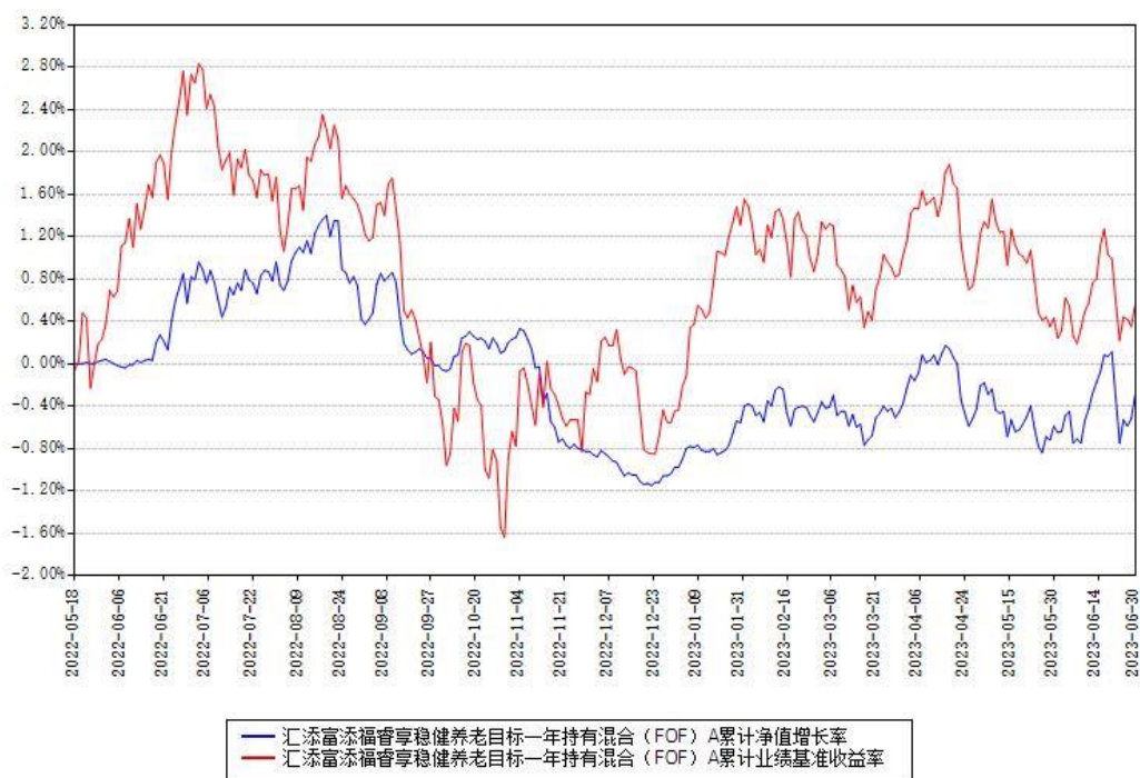
汇添富添福睿享稳健养老目标一年持有混合（FOF）A累计净值增长率与同期业绩基准收益率对比图