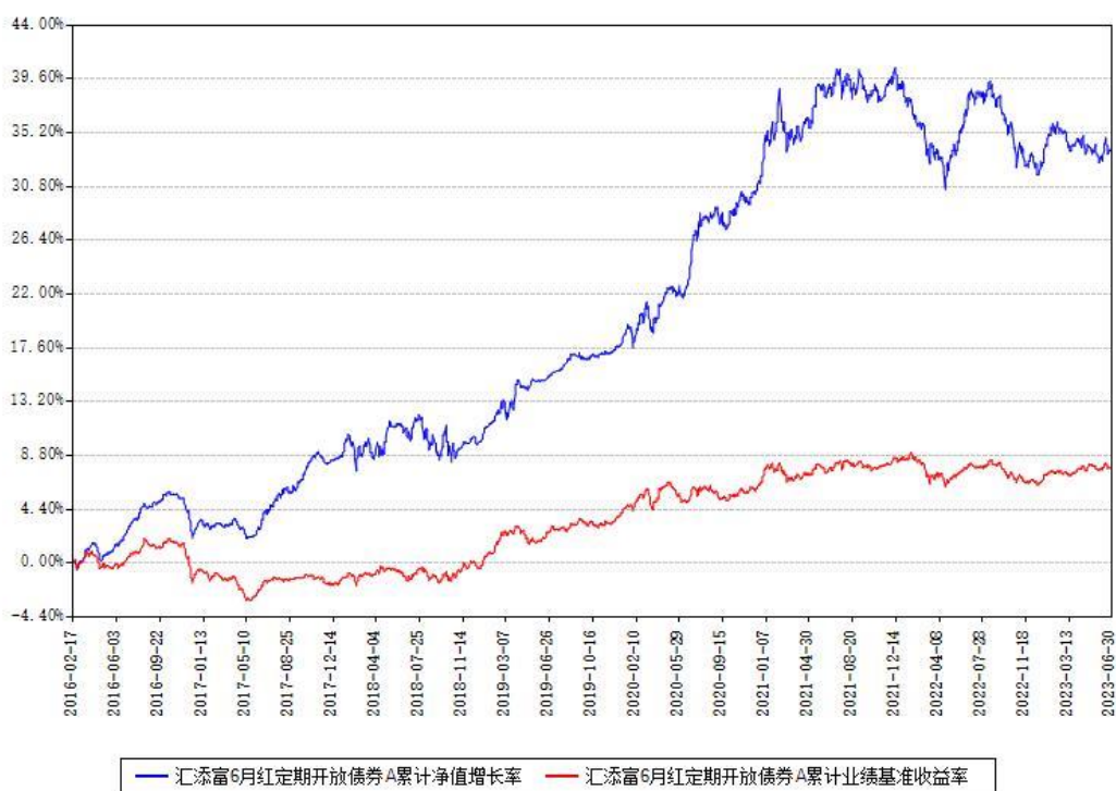
汇添富6月红定期开放债券A累计净值增长率与同期业绩基准收益率对比图