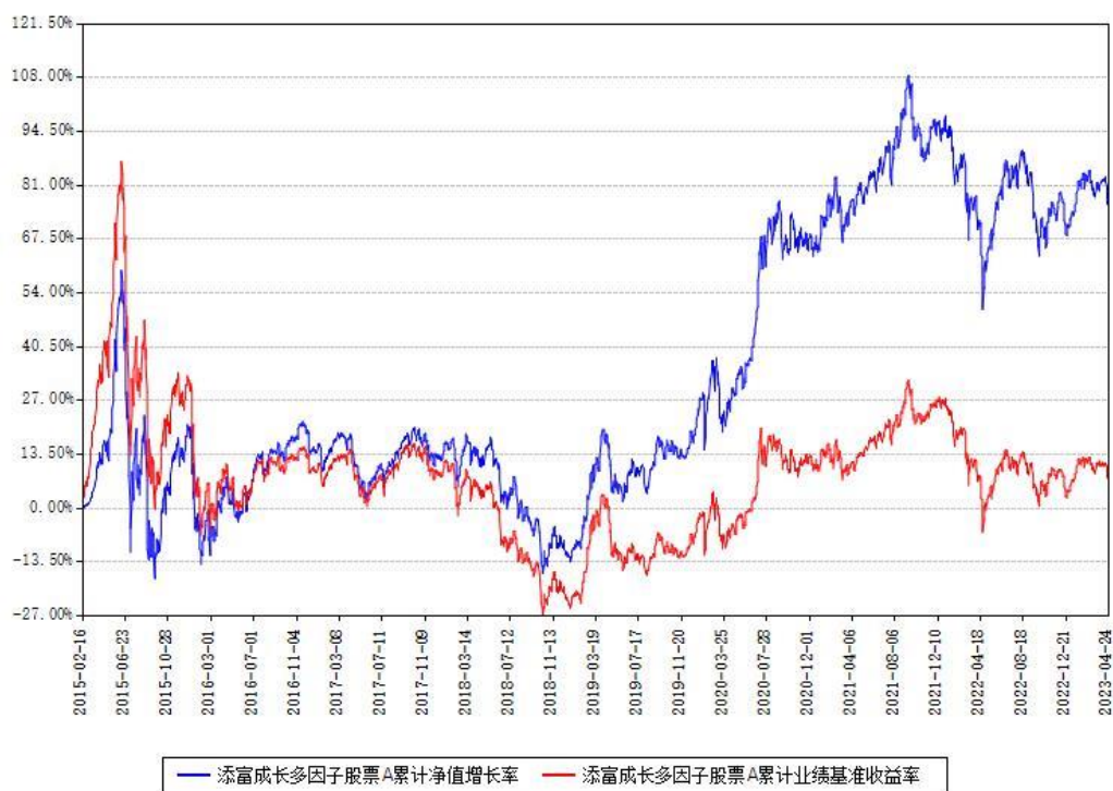
添富成长多因子股票A累计净值增长率与同期业绩基准收益率对比图