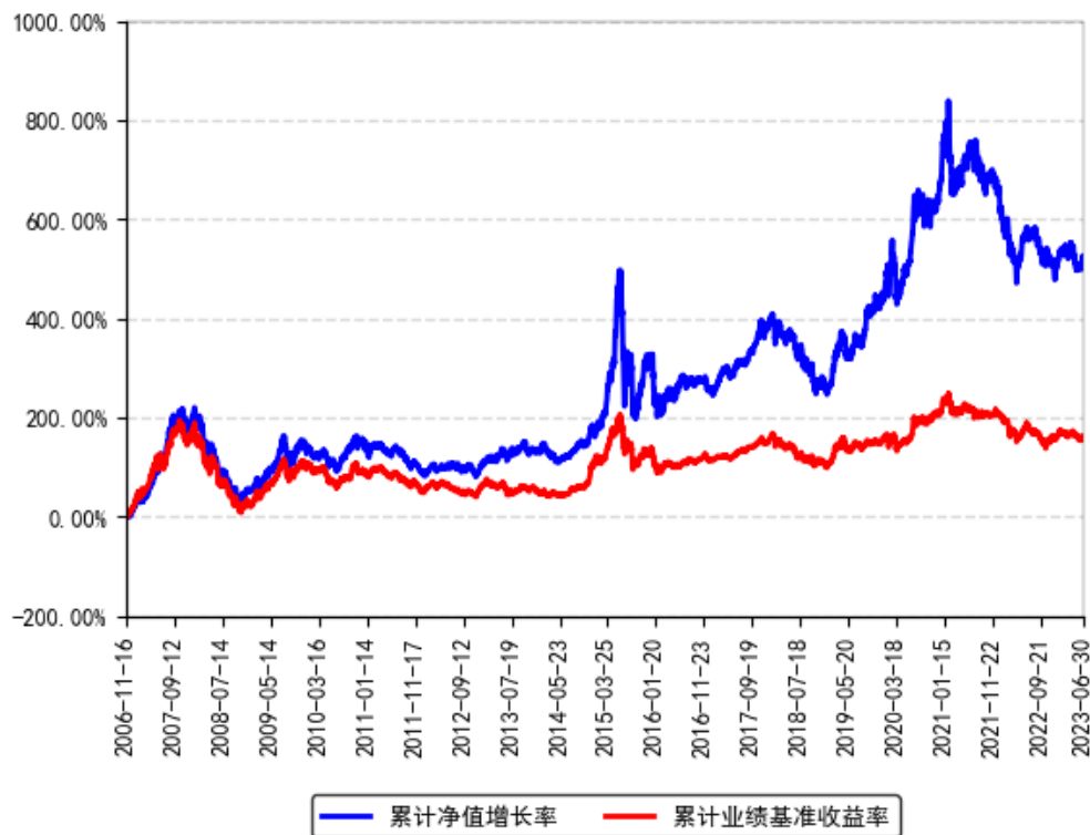
南方绩优成长混合A累计净值增长率与同期业绩比较基准收益率的历史走势对比图