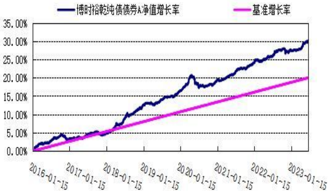
博时裕乾纯债债券 C