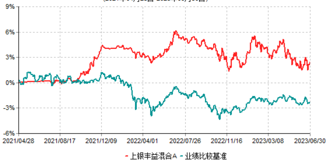
上银丰益混合A累计净值增长率与业绩比较基准收益率历史走势对比图 (2021年04月28日-2023年06月30日)