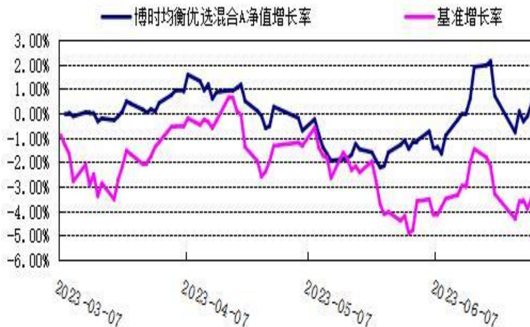
博时均衡优选混合 C