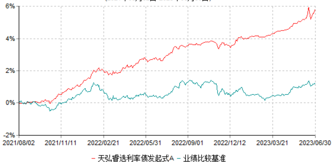
天弘睿选利率债发起式A累计净值增长率与业绩比较基准收益率历史走势对比图 (2021年08月02日-2023年06月30日)