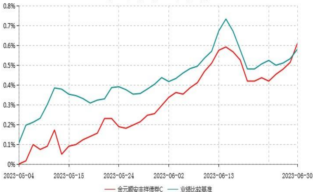
金元顺安丰祥债券C累计净值增长率与业绩比较基准收益率历史走势对比图 (2023年05月04日-2023年06月30日)